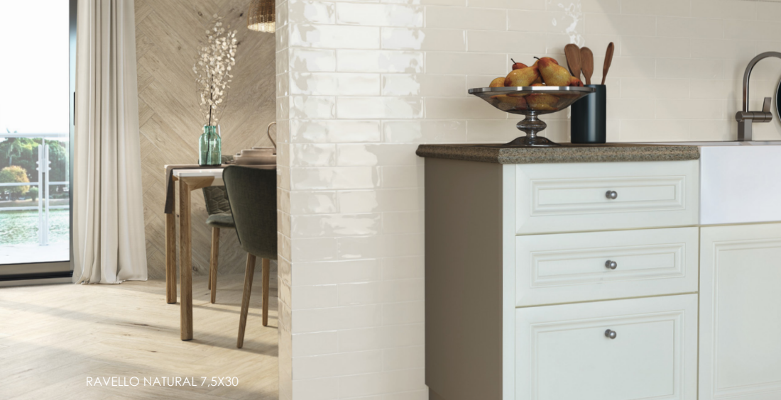
RAVELLO NATURAL 7,5X30