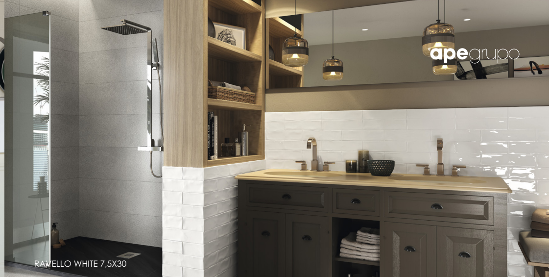
RAVELLO WHITE 7,5X30